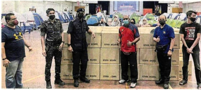
■国家王宫赈灾队伍前往灾区派发款项给灾民。