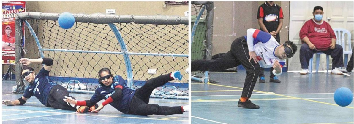
Players wearing blindfolds attempting to block the ball from entering their goal. (Right) A KL City Boys player in action.