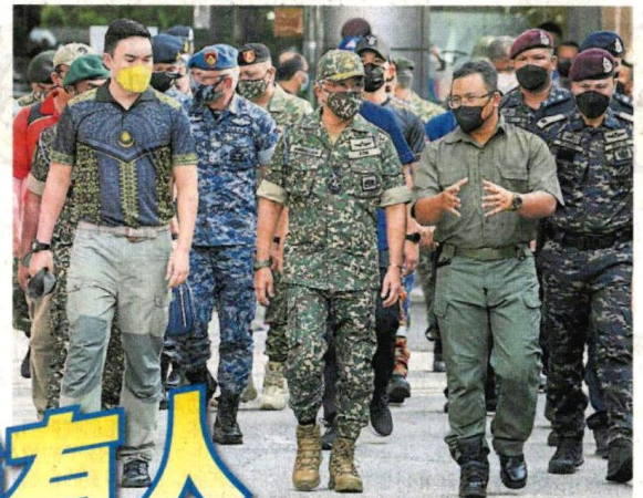
■东姑阿米尔沙（前排左起）与苏丹阿都拉聆听阿米鲁丁的汇报。