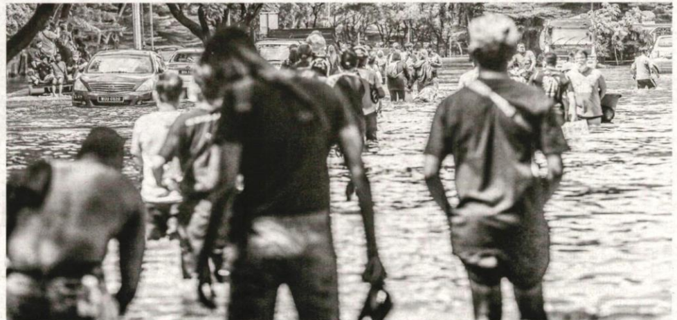
TIADA siapa terfikir Taman Sri Muda, Seksyen 25, Shah Alam akan menjadi lokasi banjir terburuk di Selangor 18 Disember lalu.

Sebelum itu, satu kejadian kemalangan dilaporkan di Lebuhraya Utara Selatan Hubungan Tengah (Elite) yang