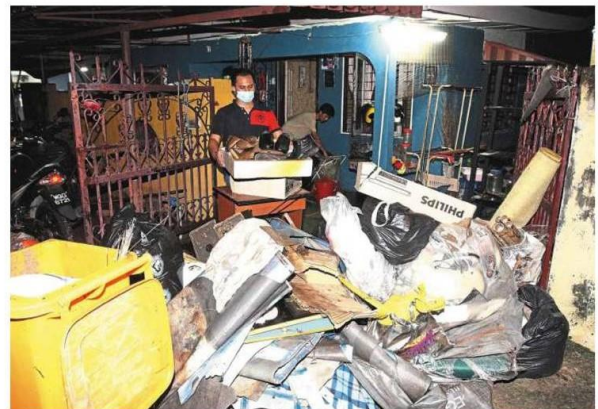
Much to do: People cleaning their house after the flash floods at Lembah Mewah in Kajang.

Norazam said the floodwater had receded when a team from the department arrived at the location at 5.57pm.