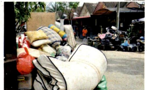
Sampah sarap dan perkakasan rumah yang rosak akibat banjir dikumpulkan oleh penduduk di hadapan rumah semasa tinjauan di Taman Seri Damal Perdana, Kuantan pada Isnin.

"Jadi, selain faktor banjir, kadang-kadang faktor setempat seperti macam orang Kelantan ni,