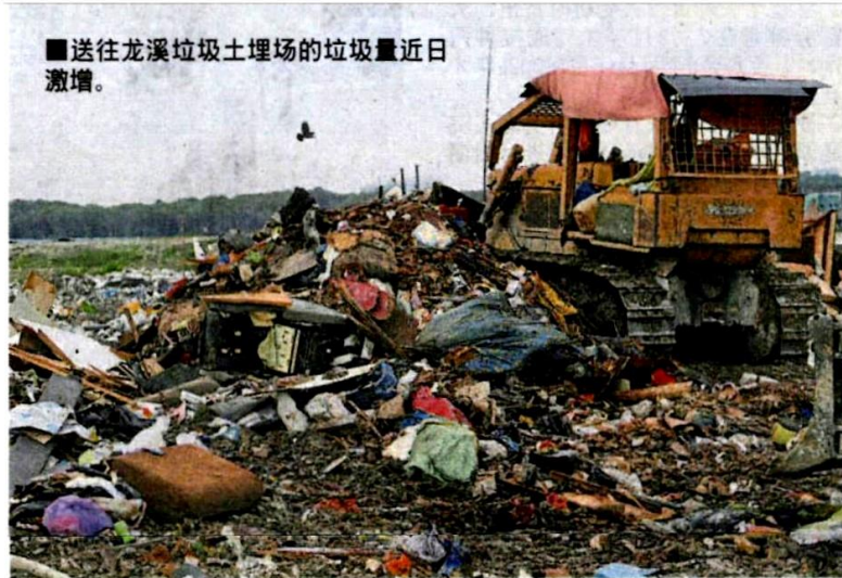
■送往龙溪垃圾土埋场的垃圾量近日激增。

(吉隆坡27日讯) 随著水灾区进行善后工作, 送往龙溪垃圾土埋场的垃圾量, 从每日500吨激增至1500吨!