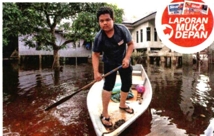
Penduduk di Kelantan dan Terengganu dinasihatkan membuat persiapan awal susulan banjir gelombang kedua dijangka melanda Khamis ini.

Di Rantau Panjang, Kelantan, biarpun masih belum hilang penat