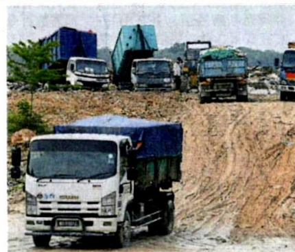
■垃圾罗厘轮流把垃圾倒入土埋场。

他说, 垃圾会用神手固定著, 然后用红泥土埋起来, 防止滋生害虫和气味。“当局将进行美化工作并建造沟渠, 当垃圾土埋场关闭时, 它只适合开发为休闲区。”