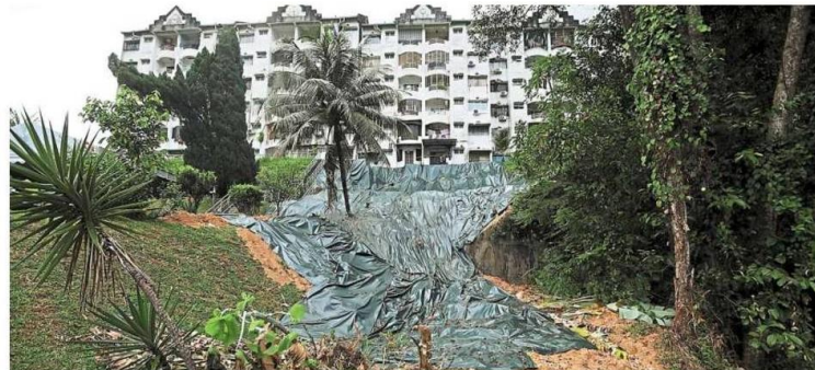
Tarpaulin sheets placed at the landslide spot near Teratai Apartment, Bandar Baru Selayang.

Selayang council takes steps to stabilise critical slopes