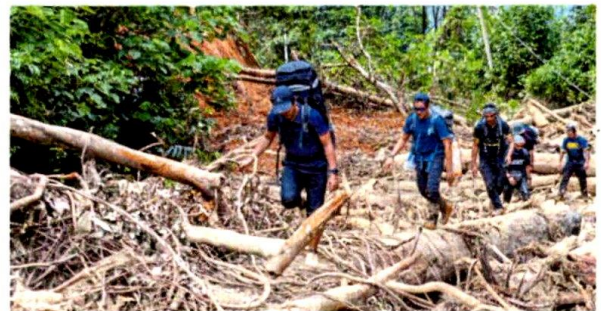
Sebahagian sukarelawan pendaki menghantar bantuan bekalan makanan dan keperluan harian ke perkampungan Orang Asli Genting Peras.