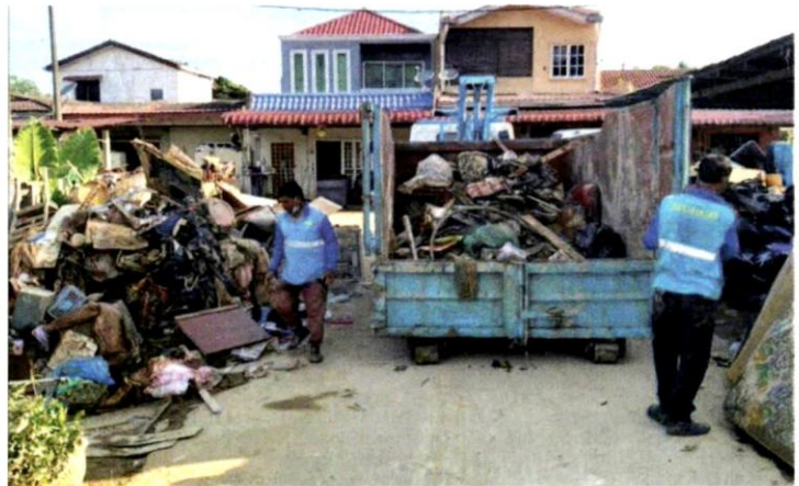
Petugas pembersihan sedang melakukan kerja membersihkan longgokan sampah dan sisa banjir di Taman Sri Nanding, Hulu Langat pada Isnin.

"Beberapa hari ini kami menghadapi kesukaran masuk ke lokasi kerana lorong sempit, jalan sesak dengan kenderaan terutama pada Sabtu dan Ahad lalu.