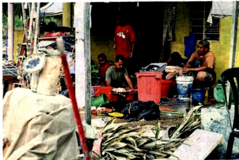
■ 榜斯里丹绒居民清理物品，图为其中一个受灾区甘